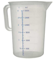
un verre doseur