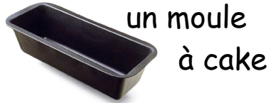
un moule à cake